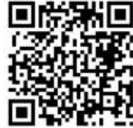
桃園市公立及非營利幼兒園 招生網